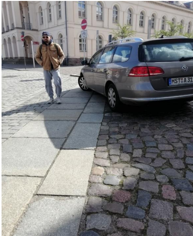
Am Markt Laufband blockiert